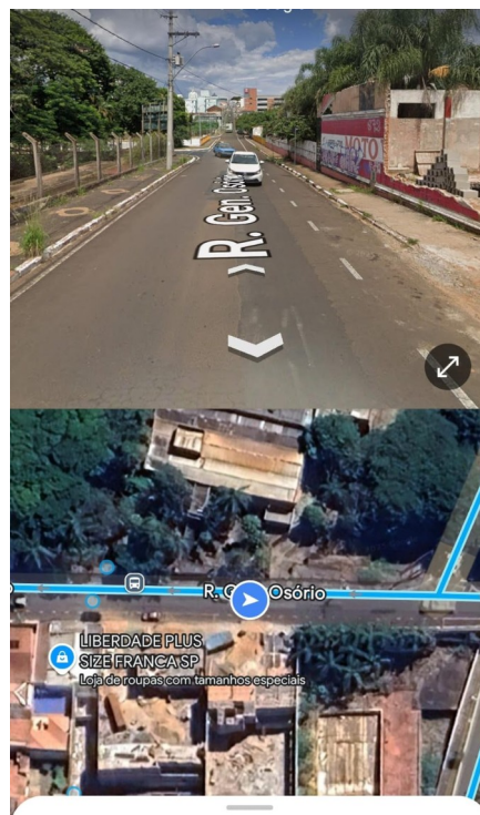
845 R. Gen. Osório